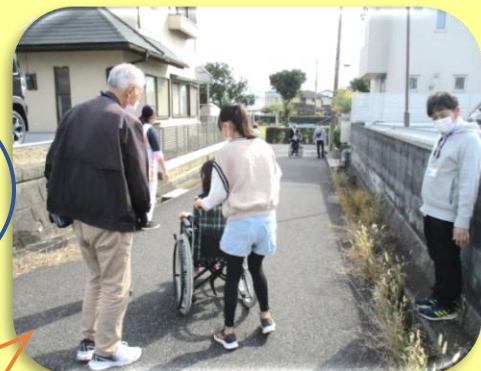
坂道やでこぼこ道を押したり 乗ったり交代しながら、全員 が体験することができました