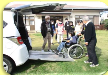
福祉車両の構造を学び、 実際に乗ってみました